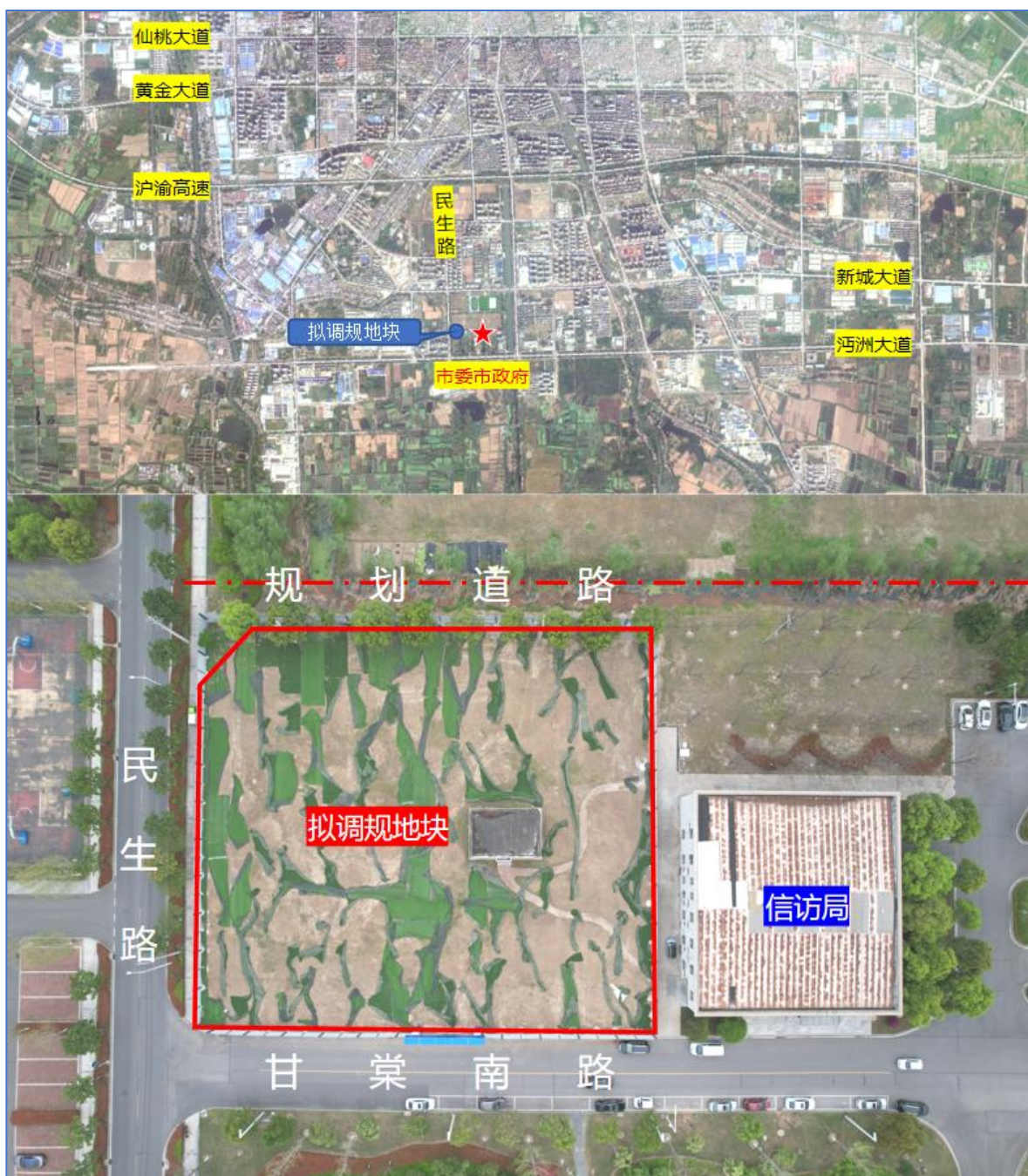
区位及现状分析图

拟调规地块位于民生路以东、甘棠南路以北、信访局以西，呈规则矩形，长 73 米宽 54 米，总用地面积为 3920.81 平方米（5.88 亩）。